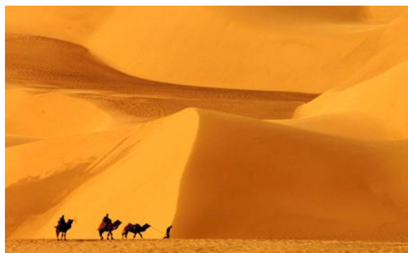
Deserto de Gobi