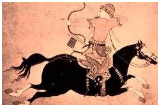
Cavaleiro Mongol (Sec. XII)

A máquina de guerra é uma potência exterior, ela é aquilo que excede. Os nômades a inventaram, mas não é o nômade que a define, e sim o conjunto de características produzido por seu modo de vida , por sua disseminação do deserto e suas linhas de fuga , suas pontas de desterritorialização e os espaços lisos que efetuam. O nomadismo foi uma resposta aos desafios impostos pelo deserto e pela estepe, regiões insólitas, cuja paisagem imprevisível dissipa os territórios e os estratos que tentam fixar-lhe sua soberania. Seu espaço é marcado apenas por traços, traços que se deslocam segundo o trajeto que percorrem. A cada passagem, um outro mundo , uma nova paisagem. E é justamente essa exterioridade, esse fora que afronta os poderes estabelecidos e se reterritorializa na “desterritorialização da própria terra”, que demarca sua política e seu devoir .